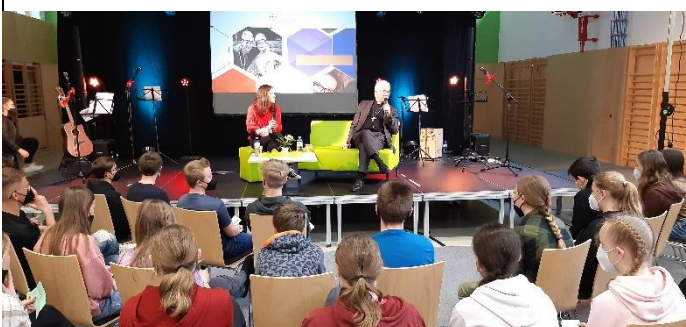
Mit dem Herrn Erzbischof in Taxenbach