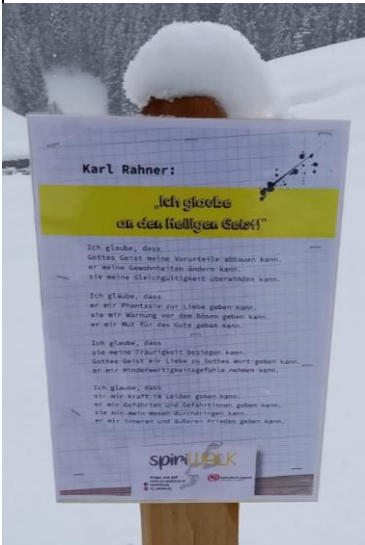
Spiri Walk in Dienten